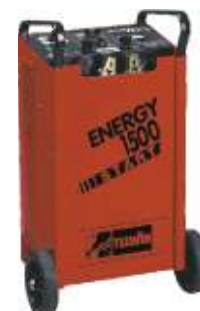
25 Energy 1500