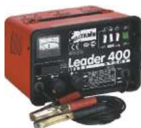
20 Leader 400