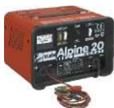
12 Alpine 20