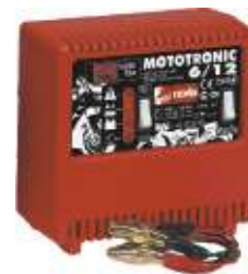
5 Mototronic 6/12