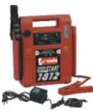
29 Speed start 1812