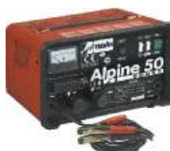
14 Alpine 50