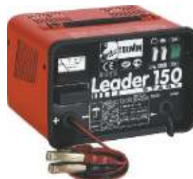
18 Leader 150