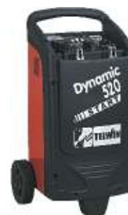
22 Dynamic 520