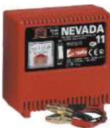
3 Nevada 11