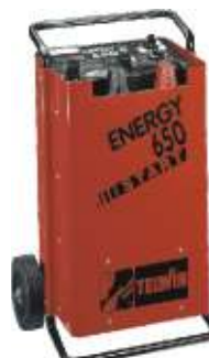
24 Energy 650