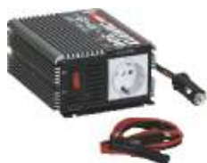
33-35 Converter 300 (500, 1000)