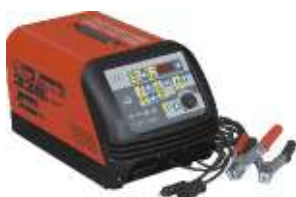
26 Startronic 330