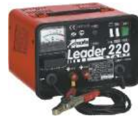
19 Leader 220