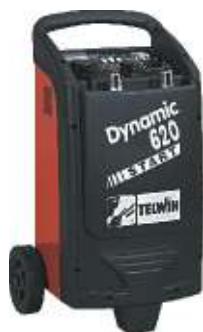
23 Dynamic 620