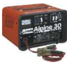
13 Alpine 30