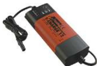
6-8 T-charge 12(18 boost, 26 boost)