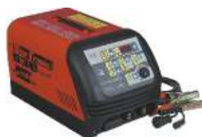
27 Startronic 530