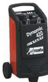
21 Dynamic 420