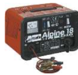
11 Alpine 18