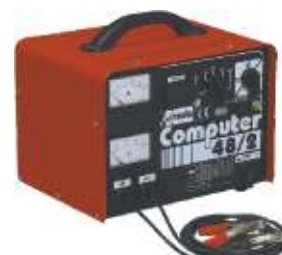
15 Computer 48/2