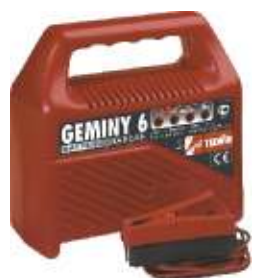
1 Geminy 6