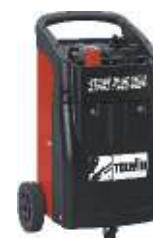
32 Start plus 3824