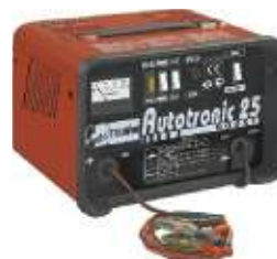
10 Autotronic 25