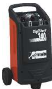
17 Digistart 340