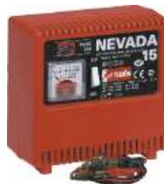
4 Nevada 15