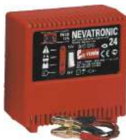
9 Nevatronic 24