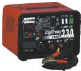
16 Digitrony 230 start