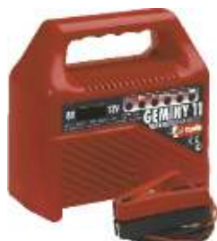
2 Geminy 11