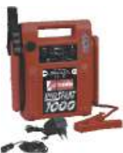
28 Speed start 1000