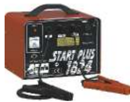
30 Start plus 1824